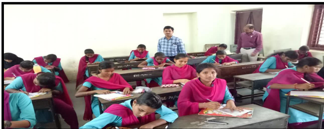
Essay Writing competition and prize distribution on the occasion of OZONE DAY