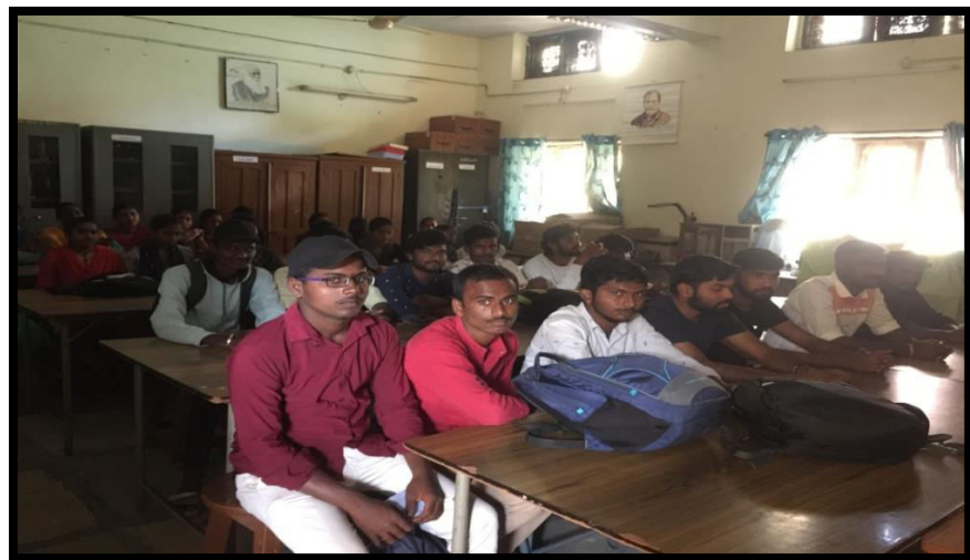
Students participated in forest day celebrations