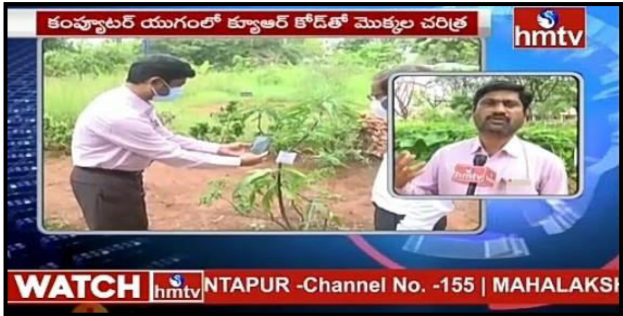
News coverage of QR code for plants in KGC in hmtv