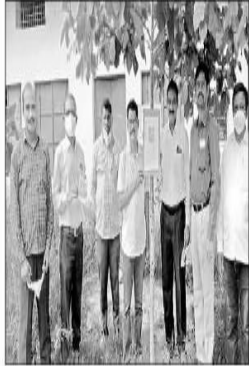
క్యూఆర్ కోడ్ ఏర్పాటు చేస్తున్న ప్రెస్ విలేజ్, అధ్యాపకులు